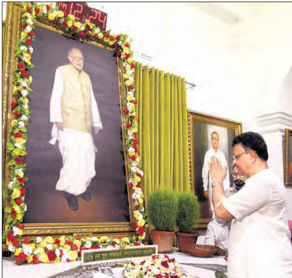
বিধানসভায় জ্যোতি বসুর ছবিতে, জন্মদিনের শ্রদ্ধা জানাচ্ছেন মন্ত্রী ফিরহাদ হাকিম।

সুতরাং বিবেচন্যে হঠাৎই একটিকে ইলেকট্রিক বাসটি আশ্রয় লেগে গিয়ে। বাসের পুর-সল্‌বলের ক্রুটের এমি-১ বাসটি বাসটি থেকে বাসটিতে আশ্রয় লাগে এবং অনুমান দমকলের। বাইপাসের অজয়নগরের কাছে এই ঘটনা হয়। সেই সময়ে বাসটিদেবের দ্রুত বাস থেকে নামিয়ে আনা হয়। কেউ আনা হতনি। বস বেশি ঠাসা ভিড়ও ছিল না। ধোঁয়া দেখার পরে বাসের ড্রাইভার্স গেট এবং অন্যান্য দরজা খুলে দেওয়া হয়। যাত্রীরা দ্রুত নামে যান। এই ঘটনায় আতঙ্ক ছড়িয়ে পড়ে। মুহূর্তের মধ্যে দাঁড় দাঁড় আশ্রয় বাসে পৌঁছ ছাই হয়ে যায়। পূর্ব বাসদপ্তর ডায়িক গাড়ি থেকে পুলিশকর্মীরা আসেন। দমকল খবর দেন তাঁরা। দমকলের একটি ইঞ্জিন যানগুলো শোঁছে আশ্রয় নিভিয়ে দেলে। এরপর শোঁড়া বাসটি সরিয়ে যওয়া হয়। কিছুক্ষণের জন্য রাষ্ট্রীয় বাসজট তৈরি হয়।